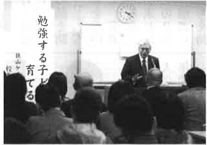
勉強する子どもに育てる

ニュースで流れる虐待の話題から始まり、しつけや校長先生の体験談、戦後教育（デュイ理論）等、今の教育の中で貴重な事を沢山教えて頂きました。