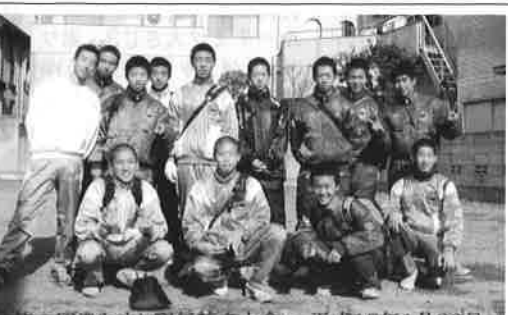
第一回奥行きし駅伝競走大会 平成15年1月26日

私が多感すると共に、ほつと温かい気持ちになれるのである。 教師となった今、私は自分の高校時代を振り返る機会が多くなった。授業や部活動、友人の顔などが懐かしく浮かんでくる中で、あの「温い味噌汁」の味は一層鮮明に思い出す。その度に、両親や多くの人の支えがあったから今の自分があることを実感すると共に、