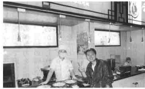
▲北京旅行でのひとコマ

優秀な人々と共に仕事をしたいける自分でありたい」という、大きな方向性に全く変化はありませんでした。