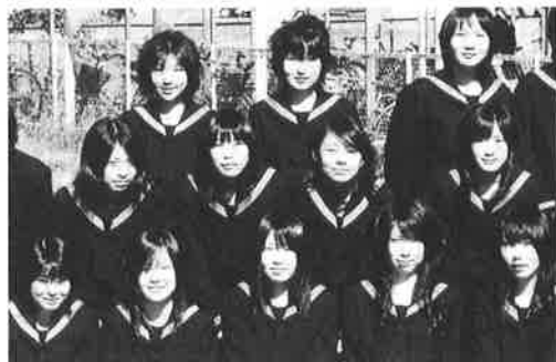
▶ 高校時代 一列目中央

OG市ノ川さんプロフィール 平成一九年本校卒業。平成一九年早稲田大学法学部入学。現在4年生、労働法ゼミに所属。