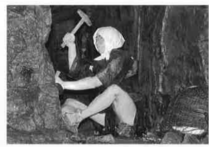
▲足尾銅山の坑道内

鎌倉方面 11月10日(水) 建長寺 ↓ 精進会席 鉢の木 (昼食) ↓ 鎌倉宮・土牢 ↓ 源頼朝の墓 ↓ 鶴岡八幡宮・小町通り