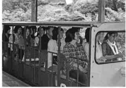
▲トロッコで銅山へ

最期は江戸時代から約四百年にわたり銅が発掘された足尾銅山の見学でした。実際に坑道を歩きつつ、過酷な労働に耐えた多くの人の苦勞を思わずにはいられません。まさに「百聞は一見に如かず」、貴重な経験でした。もちろん買い物やお喋りなどの楽しい時間もあり、心に残る良い旅行になりました。