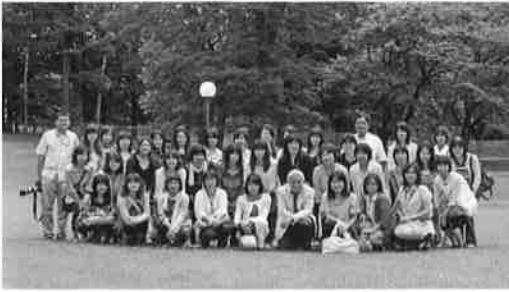
▲日光アストリアホテル中庭にて

最期は江戸時代から約四百年にわたり銅が発掘された足尾銅山の見学でした。実際に坑道を歩きつつ、過酷な労働に耐えた多くの人の苦勞を思わずにはいられません。まさに「百聞は一見に如かず」、貴重な経験でした。もちろん買い物やお喋りなどの楽しい時間もあり、心に残る良い旅行になりました。